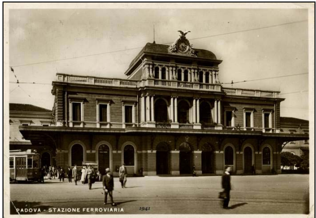
PADOVA - STAZIONE FERROVIARIA 1941