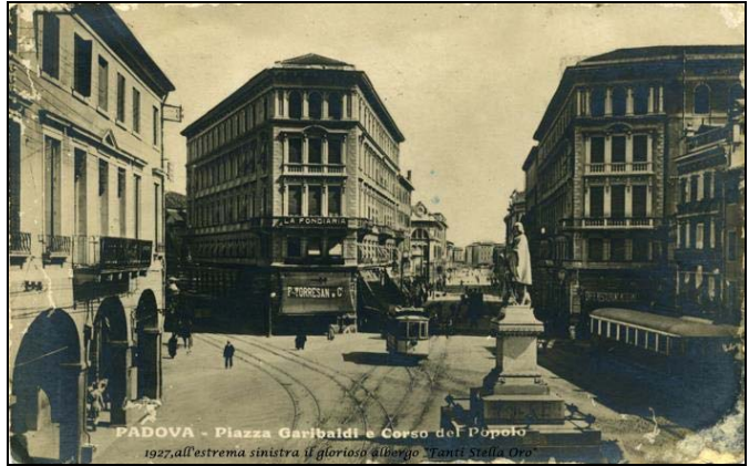
PADOVA - Piazza Garibaldi e Corso del Popolo 1927, all'estrema sinistra il glorioso albergo "Tandè Stella Oro"