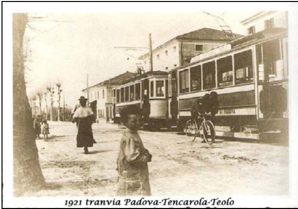
1921 tranvia Padova-Tencarola-Teolo