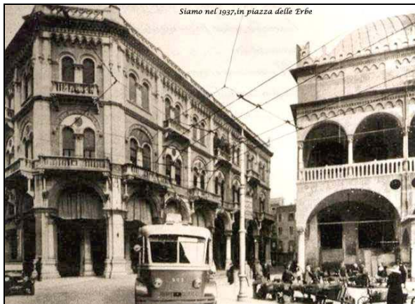
Siamo nel 1937, in piazza delle Erbe